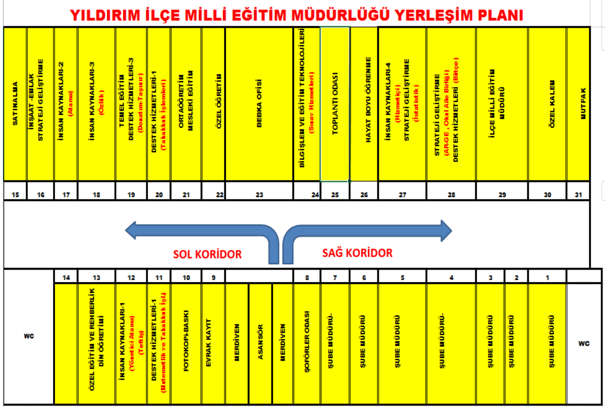
Şekil-2 Yıldırım İlçe Milli Eğitim Müdürlüğü Yerleşim Planı

Müdürlüğümüz Yıldırım Kaymakamlığı 3.katında toplamda 29 oda ile hizmet vermektedir.