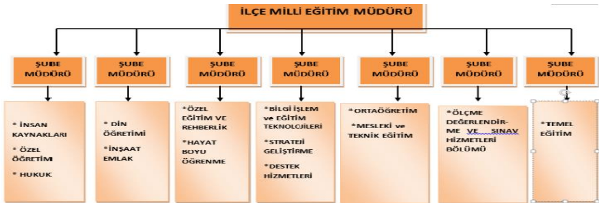
Şekil-1 Yıldırım İlçe Milli Eğitim Müdürlüğü Teşkilat Yapısı